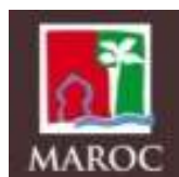
Ministère du Tourisme

Doté d'une enveloppe de 420 millions de Dhs, à horizon 2020, « Moussanada Siyaha » est le fruit d'un partenariat entre :